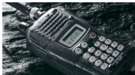
Wasserdicht entsprechend IPX4-Norm

Je nach Vorliebe des Benutzers können die Funktionen von Abstimmknopf und Up/Down-Tasten ausgetauscht werden.