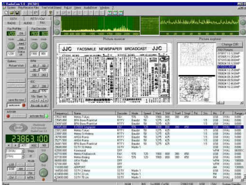
RadioCom 5.0 HAM-Radio Play and Tool-Pages